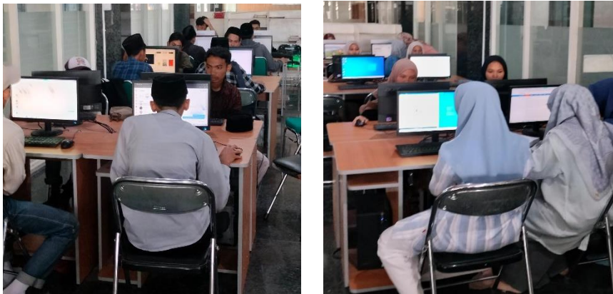
Gambar 5. Pemanfaatan Ipusnas oleh Mahasiswa

Salah satu fasilitas yang disediakan oleh perpustakaan Universitas Islam Tribakti Lirboyo Kediri dalam memfasilitasi mahasiswa dalam penggunaan aplikasi IPUSNAS adalah dengan menyediakan wifi gratis bagi setiap pengunjung perpustakaan. Wifi memudahkan mahasiswa untuk mengakses berbagai macam platform pembelajaran digital. 24 Wifi yang disediakan oleh pihak perpustakaan tidak memiliki batas waktu penggunaan, sehingga mahasiswa dapat mengakses literasi secara online terutama pada aplikasi IPUSNAS setiap saat selama mahasiswa di perpustakaan.