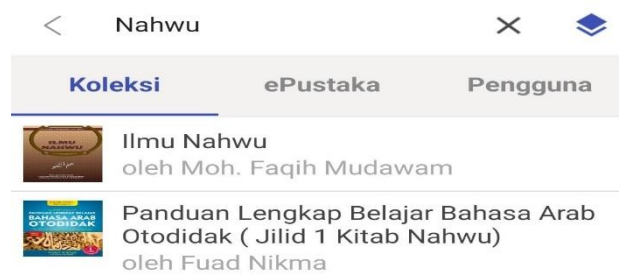
Gambar 3. Hasil Pencarian Kata Kunci “Nahwu”

buku nahwu yang berjudul “Ilmu Nahwu” dan “ Panduan Lengkap Belajar Bahasa Arab Otodidak ( Jilid 1 Kitab Nahwu)”.