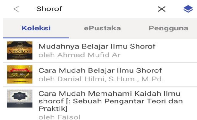
Gambar 4. Hasil Pencarian Kata Kunci “Shorof”

Adapun dari segi shorof , koleksi buku-buku yang disediakan oleh aplikasi IPUSNAS antara lain buku dengan judul “Mudahnya Belajar Ilmu Shorof”, “Cara Mudah Belajar Ilmu Shorof”, dan “ Cara Mudah Memahami Kaidah Ilmu Shorof”. Koleksi Judul-judul buku yang disediakan aplikasi IPUSNAS diatas diharapkan dapat membantu meningkatkan kemampuan bahasa Arab mahasiswa Universitas Islam Tribakti Lirboyo Kediri.