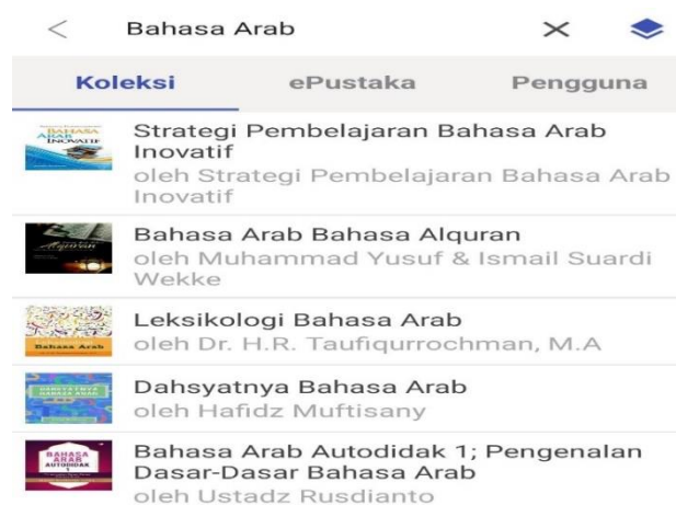
Gambar 2. Pencarian Koleksi Buku Bahasa Arab

Setelah proses install , selanjutnya mahasiswa bisa membuat akun pada menu “daftar sekarang” dengan memasukkan username , email , password dan nomor telepon. Setelah melengkapi data diatas, selanjutnya mahasiswa melakukan verifikasi email dan setelahnya mahasiswa bisa mencari buku yang diinginkan terutama buku bahasa Arab dengan memasukkan kata kunci pada kolom pencarian buku.