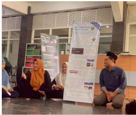
Gambar 6. Sosialisasi terkait Aplikasi Ipusnas

Selain menyediakan fasilitas berupa wifi dan komputer, perpustakaan Universitas Islam Tribakti Lirboyo Kediri juga memberikan pelatihan dan sosialisasi. Adapun maksud dari sosialisasi adalah proses dimana seseorang mendapatkan hal-hal baru yang berasal dari orang lain. 26 Dalam hal ini kegiatan sosialisasi dilaksanakan oleh staf perpustakaan dan diterima oleh mahasiswa Universitas Islam Tribakti Lirboyo Kediri dan dilakukan di lokasi perpustakaan yang dilaksanakan per kelas.