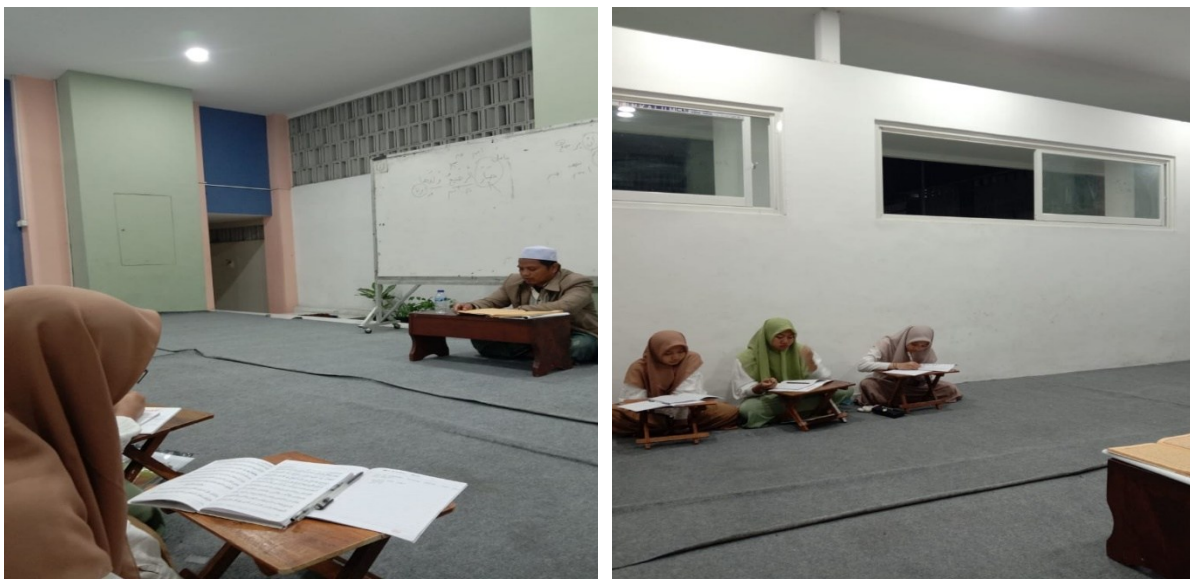
Gambar 2. Aktivitas Bimbingan Baca Kitab

Secara keseluruhan, kegiatan pemberdayaan ini membuktikan bahwa melalui pendekatan partisipatif, pembelajaran kitab kuning dapat dihadirkan secara inklusif di lingkungan non-pesantren. Panti Asuhan Sunan Kalijaga menjadi contoh nyata bahwa keterbatasan sumber daya bukanlah penghalang untuk membangun pendidikan Islam yang berkualitas. Dengan kolaborasi yang kuat, semangat pengabdian, dan pendampingan berkelanjutan, anak-anak yatim dapat tumbuh menjadi generasi yang berilmu, berakhlak, dan siap menjadi penerus tradisi keilmuan Islam di masa depan.