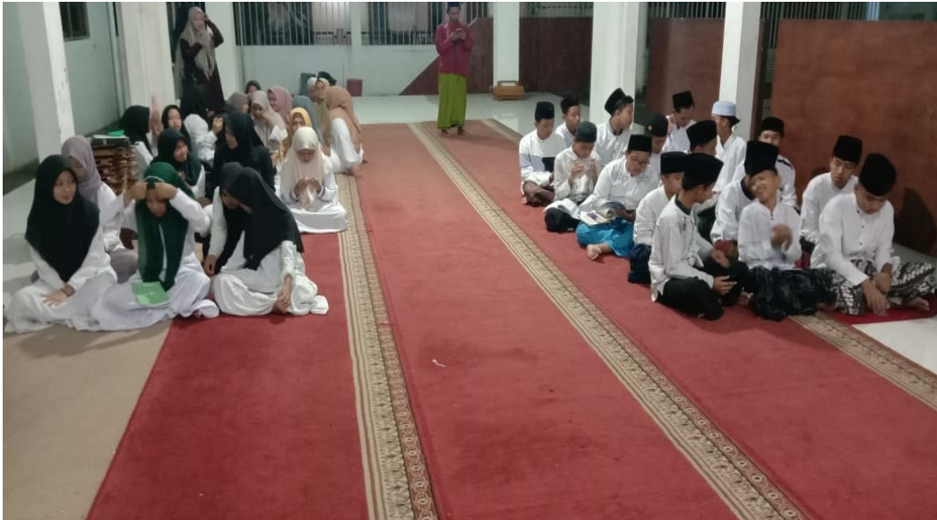
Gambar 1. Santri Yayasan Sunan Kalijaga Malang

Tahapan kegiatan dimulai dari proses identifikasi masalah dengan melakukan observasi dan wawancara di lapangan. Hasil temuan menunjukkan bahwa sebagian besar anak panti belum memiliki kemampuan dasar dalam membaca kitab kuning, terutama dalam aspek kaidah nahwu dan sharaf . Berdasarkan hasil tersebut, tim menyusun perencanaan yang meliputi jadwal belajar, modul ajar, dan metode pembelajaran yang adaptif terhadap kondisi peserta. Pembelajaran dilakukan secara intensif menggunakan kombinasi metode bandongan dan sorogan , sehingga memungkinkan anak-anak belajar sesuai kemampuan masing-masing.